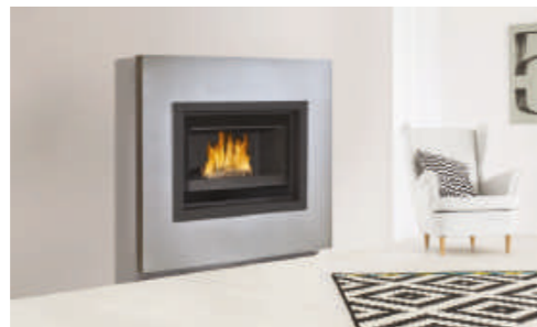
Cheminée GRANNY Cadre époxy gris pailleté + Foyer ELISEO 77 W