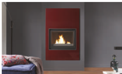
Cheminée JADE Epoxy rouge pourpre + Foyer ELISEO 77 W