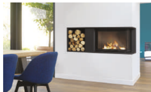
Cheminée NINA CV Epoxy noir sablé + Foyer SIGMA 79 CV