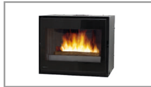
Insert GAMMA 70-60 Insert en fonte avec ventilateurs Puissance : 10 kW Classe énergétique : A+