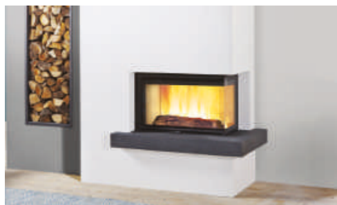
Cheminée MATISSE CV Pierre bleue + Foyer SIGMA 72 CV