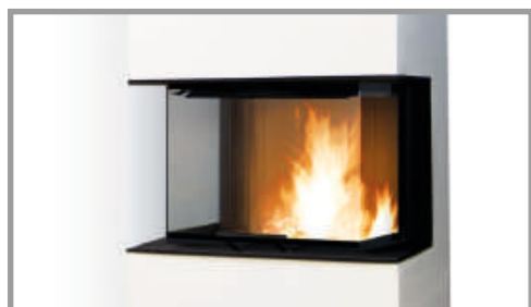
Foyer SIGMA 87 3V Foyer porte relevable 3 côtés vitrés Puissance : 7,8 kW Classe énergétique : A+